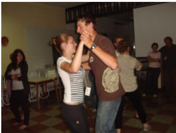
„Polka” w wykonaniu uczestników projektu

Projekt ten dał nam możliwość poznania rówieśników oraz tradycji z różnych państw. Dzięki temu spotkaniu zrozumieliśmy jak bardzo ważny jest wolontariat dla naszego społeczeństwa. Zobaczyliśmy jak małe rzeczy mogą cieszyć innych, którzy nie mają wiele. Zwiedziliśmy również wiele ciekawych i pięknych miejsc.